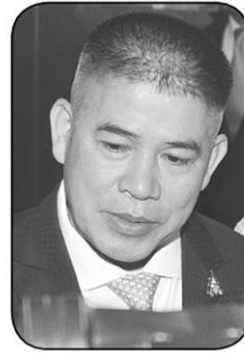
ร.อ.ธรรมนัส พรหมเผ่า