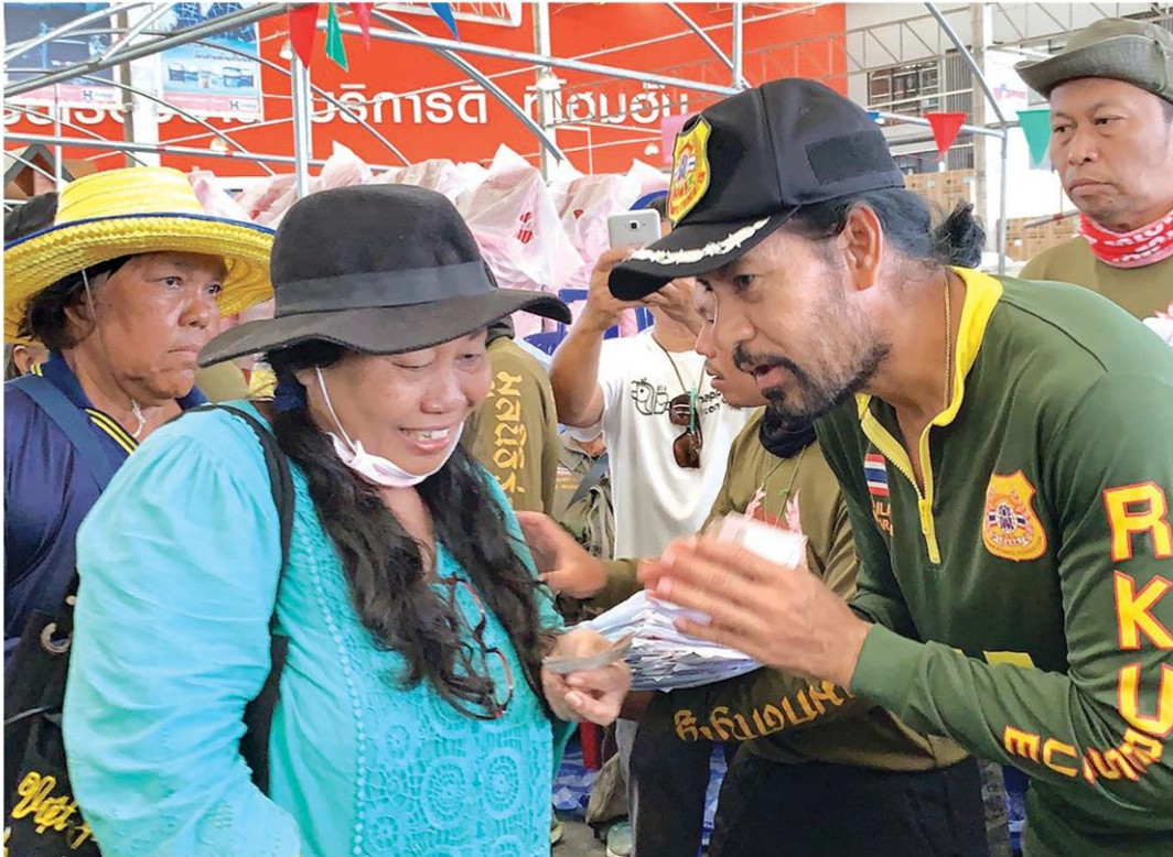
🏠 ยังลุยแจก - พระเอก 'บิณฑ์ บรรลือฤทธิ์' พร้อมคณะวัดเข้ยมปลอบใจชาวบ้าน พร้อมแจกเงินช่วยเหลือครอบครัวละ 5 พันบาท ที่ศูนย์พักพิงชั่วคราว หน้าโรงเรียนต.บึงใหม่ อ.วารินชำราบ จ.อุบลฯ เมื่อวันที่ 21 ก.ย.

หินลาด ไหลหลากเข้าท่วมบ่อน้ำพุร้อน ตั้งอยู่ หมู่ที่ 6 ต.หินลาด อ.ทองผาภูมิ จ.กาญจนบุรี สถานที่ท่องเที่ยวชื่อดัง สาเหตุเกิดจากฝนที่ ตกติดต่อกันเป็นเวลาหลายวันจนทำให้ ปริมาณน้ำในลำห้วยสูงขึ้นและไหลแรงจน หลากเข้าท่วมบ่อน้ำพุร้อนดังกล่าว